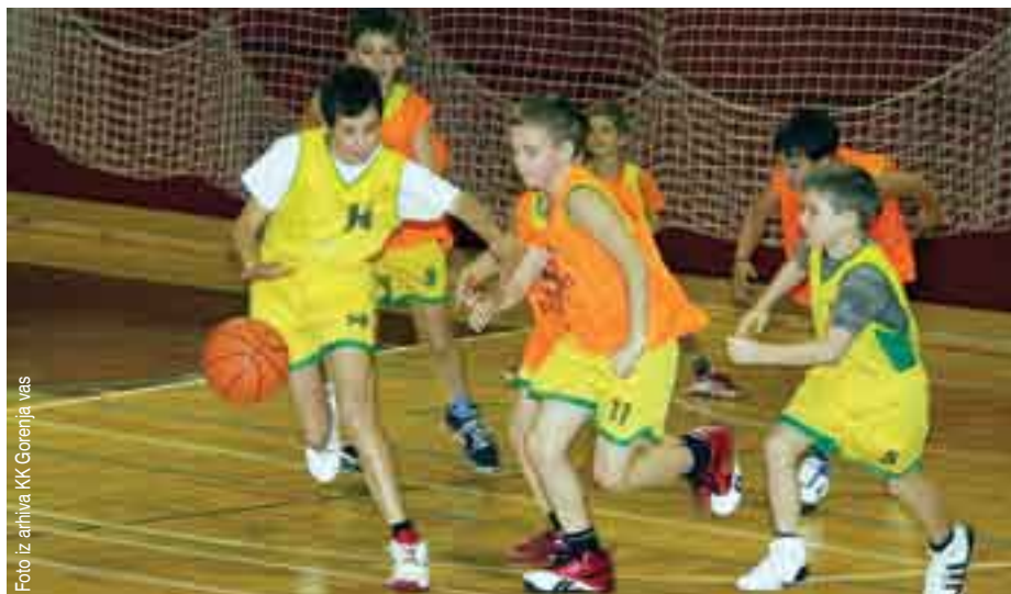
Na košarkarskem festivalu so se predstavili tudi najmlajši.