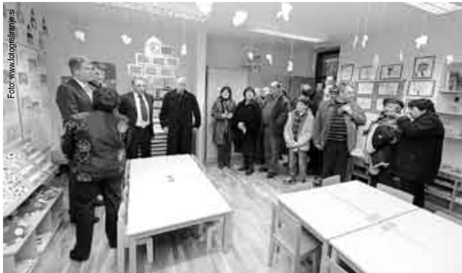
V novi igralnici po proslavi