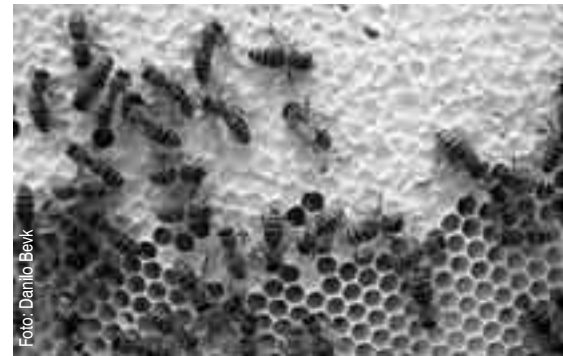
Zrel med čebele pokrijejo z voskom.

Na trgovskih policah lahko najdemo medove različnih cen in porekla. Najcenejši so praviloma