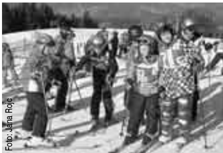
Zimska šola v naravi na Črnem vrhu

Pet dni zimske šole v naravi so učenci 6. razreda dobro izkoristili na smučišču na Črnem vrhu, v bazenu v Cerknem in ob vseh drugih dejavnostih, ki zapolnijo dni bivanja stran od staršev, le s sovrstniki in učitelji. Smučarsko znanje so uspešno nadgrajevali vse od poznavanja smučarskega bontona do obvladovanja smuči in strmin. Obiskali so muzej, kjer so razstavljeni cerkljanski laufarji, zgodovina, delo in stari predmeti Cerknega. Bili so zadovoljni s hrano, vremenom, učitelji, hotelskimi sobami, navdušeni nad plavanjem in smučanjem. Ob zaključku zadnjih dveh dejavnosti so prejeli