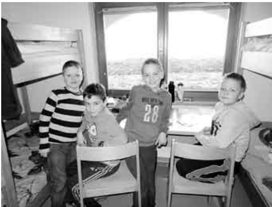
Tretješolci v šoli v naravi na Medvedjem Brdu