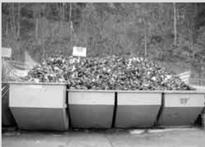
Na leto v občini zberemo 12 ton odpadne embalaže od sveč – trikrat toliko, kot jo je na fotografiji.