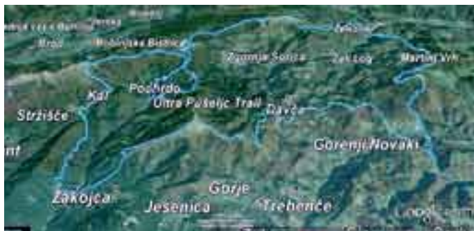
Trasa prvega ultra traila v Sloveniji

To čudovito primorsko-gorenjsko naravno okolje hribov in dolin ter pestrih zgodovinski dogodkov je primerno za vse vrste pohodov, zgodovinskih raziskovanj, gorskih tekov in rekreacije. Že od leta 2002 tu poteka Gorski maraton štirih občin – GM4O, od leta 2013 pa Pušeljc gorskih tekov na Črno prst, Blegoš, Ratitovec in GM4O. Letos pa bo prvič organiziran še pravi ultra trail v Sloveniji – ULTRA PUŠELJC TRAIL, dolg 100 kilometrov, ki jih bodo tekači odtekli po Baški grapi, Cerkljanski, Selški in Poljanski dolini.