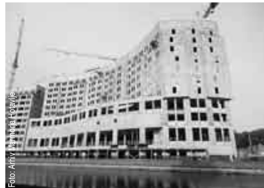
Fasado hotela s petimi zvezdicami bodo izdelali hotaveljski kamnoseki. Kompleks bo poleg hotela zajemal še stanovanjski in poslovni del.

Podjetje se tako vse bolj usmerja na ameriški trg in trge držav nekdanje Sovjetske zveze, v arabski svet ter na nemški in avstrijski trg. Poleg omenjenega projekta Marmor Hotavlje zaključuje z deli na Hotelu Ritz Carlton v Kazahstanu, njihova hčerinska družba nadaljuje dela na Hramu sv. Save v Beogradu, vseskozi pa s kamnom opremljajo tudi največje in najprestižnejše jahte, ki se v tem