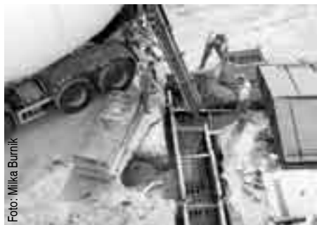
Jet grouting vrtine so globoke 13 metrov