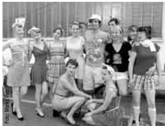
Tekmovalke v petah

V športnem delu se je skoraj 200 udeležencev pomerilo v malem nogometu, floorballu, tenisu in namiznem tenisu. Tekmovanja v košarki zaradi premajhnega zanimanja in slabega stanja športne dvorane tokrat niso izvedli. So pa letos imeli posebno tekmovanje v teku z visokimi petami, kjer so se pomerile samo tekmovalke. Moški predstavniki so bili bolj številčni, ko so se merili v metu žoge za tri točke in lovljenju ravnotežja na kolesu ter plezanju na umetni steni. Tisti, ki imajo potrebno opremo in kolesa, so se preizkusili v downhillu, radovednežem pa so z veseljem predstavili ta adrenalinski šport. Za glasbene ritme in zabavo je poskrbel DJ Pero, lačni pa so lahko okusili že tradicionalno specialiteto – pečenega odojka. Prireditev so podprli številni sponzorji, predvsem lokalna podjetja.