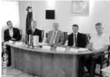
Na predstavitvi projekta v Škofji Loki

Občina Gorenja vas - Poljane je avgusta prejela odločbo o dodelitvi nepovratnih sredstev za projekt »Oskrba s pitno vodo v porečju Sore« iz Kohezijskega sklada Evropske unije. Projekt predvideva gradnjo vodovodnega sistema Trebija–Poljane–Škofja Loka (odsek zbirni jašek Trebija–razdelilni jašek Podgora) in treh vodovodnih podsistemov: Trebija–Gorenja vas–Todraž, Trebija–Podgora in Poljane. Skupaj bo na območju občine zgrajenih 16,46 km cevovodov, štiri vodohrani, tri črpališča in klorinarska postaja.