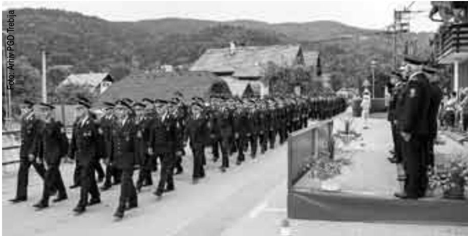
Poleg slavnostne akademije je PGD Trebija pripravil tudi gasilsko paradu.

PGD Trebija v letošnjem letu obeležuje 80-letnico obstoja in delovanja. Ob tej priložnosti so v dvorani gasilskega doma pripravili slavnostno akademijo s podelitvijo priznanj in odlikovanj najbolj zaslužnim gasilkam in gasilcem. Izšel je tudi zbornik z naslovom »80 let gasilstva na Trebiji«, ki ga bodo v kratkem prejela vsa gospodinjstva KS Trebija. V 80 letih obstoja najdemo 122 zapisov o intervencijah (92 pri požarih in 30 pri tehničnih intervencijah), od tega 50 izven območja PGD Trebija.